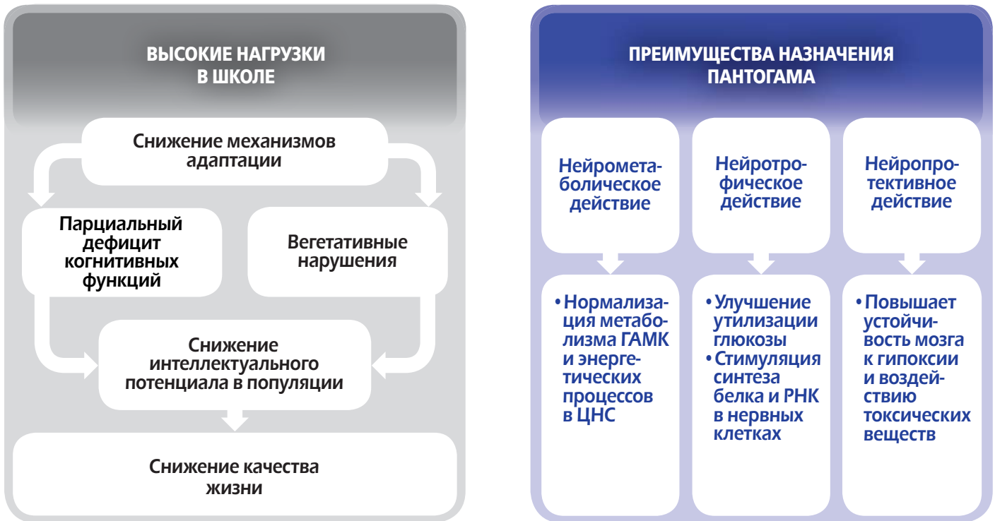
Рисунок 1. Свойства и преимущества назначения препарата Пантогам®

ропные препараты. Безусловно, прямое активирующее влияние на обучение, внимание, память, умственную деятельность – необходимое условие лечения когнитивных расстройств, однако большинство ноотропных препаратов не обладают вегетостабилизирующим действием и в их действии на ЦНС преобладает психостимулирующий эффект.